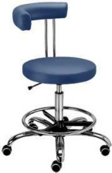
D10L hammaslääkärin selkänojallinen tuoli