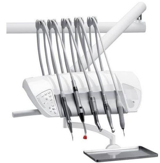
DAI70 - instrumenttisilta