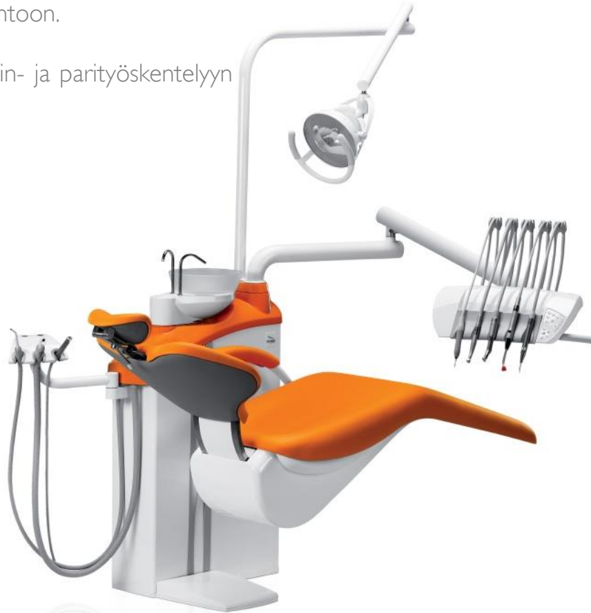
DA170 - HOITOKONE